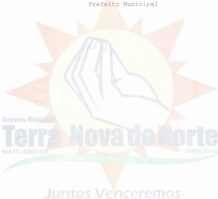
MANOEL RODRIGUES DE FREITAS NETO Prefeito Municipal

Gabinete do Prefeito de Terra Nova do Norte, Estado de Mato Grosso, em 14 de maio de 2012.